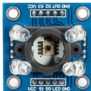
Figura 2: Sensor TCS3200

Para este protótipo foi escolhido o sensor de cor RGB modelo TCS3200 (Fig. 2) cujo qual irá atender nossos requisitos na questão de ser compacto e leve. Além disso, a forma de detecção de cor atende a necessidade que foi proposta na construção do protótipo (THOSEN, 2016).